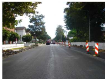
Straßenbau ( 1. BA)