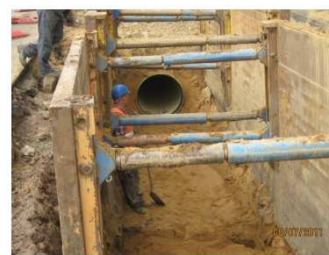
Stauraumkanal (2. BA)