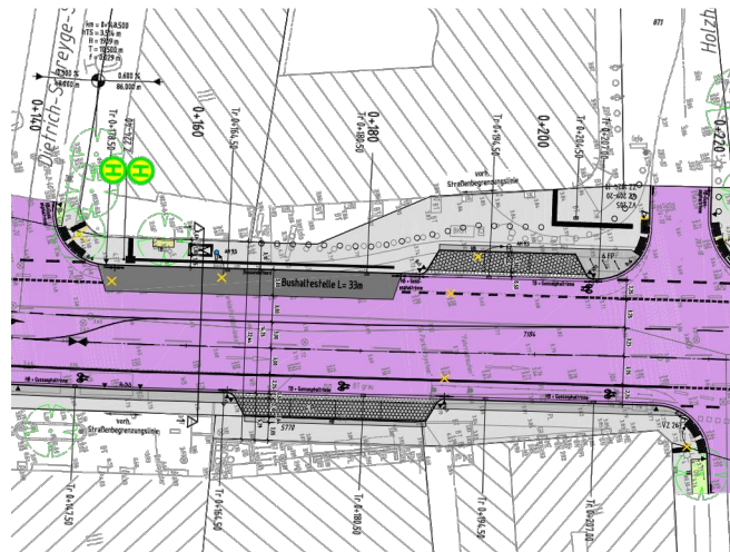
Ausschnitt Lageplan Straßenbau