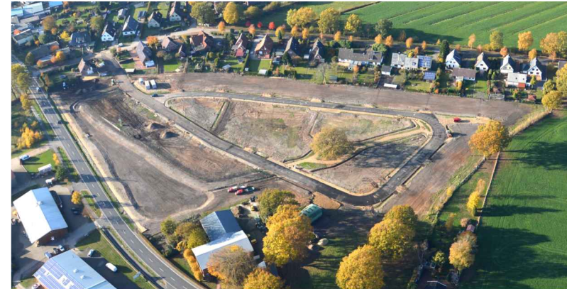
Luftbild Planungsgebiet