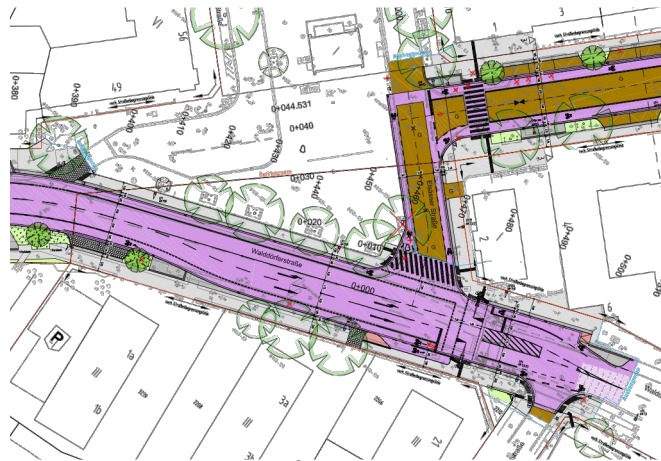
Ausschnitt Lageplan Straßenbau